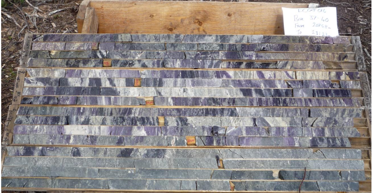
Abbildung 1: Abschnitt der hochgradigen Flussspatzone in Bohrung EC08-016